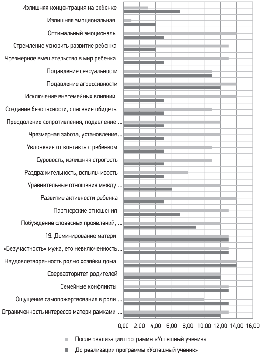
Диаграмма. Наглядное соотношение динамики реализации программы: «Успешный ученик» среди матерей воспитанников