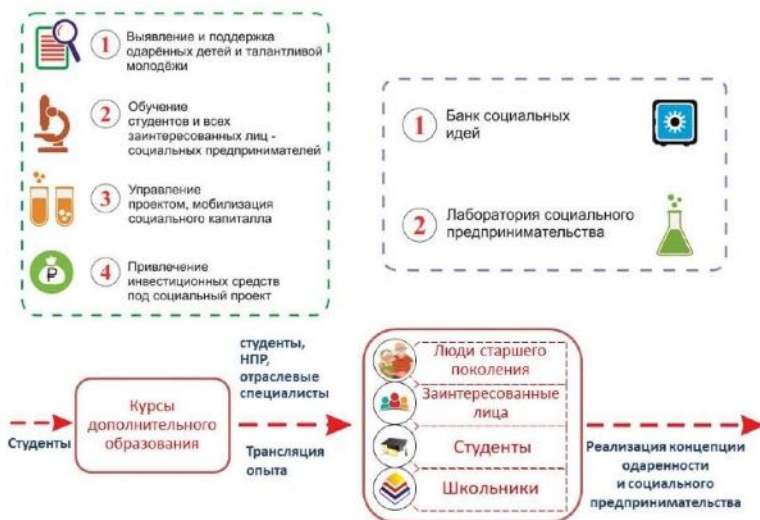
Рисунок 1. Модель функционирования центра «Территория возможностей».

Перед центром «Территория возможностей» ставятся следующие задачи: