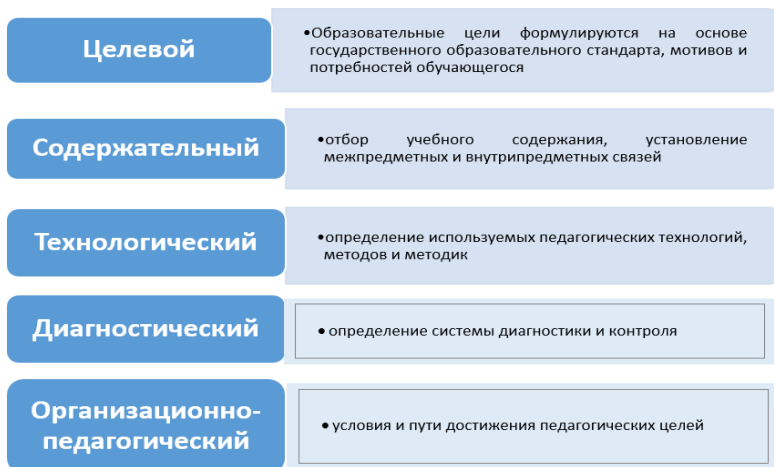
Рис.2. Структура ИОМ

Структура индивидуального образовательного маршрута включает следующие компоненты (см. рис. 2).