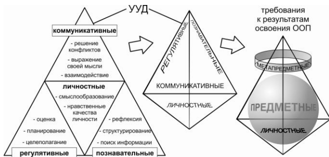
Рис. 1. Взаимодействие между УУД и требованиями к результатам освоения ООП

Дифференцированная оценка деятельности учащихся на уроках технологии позволяет проверять: