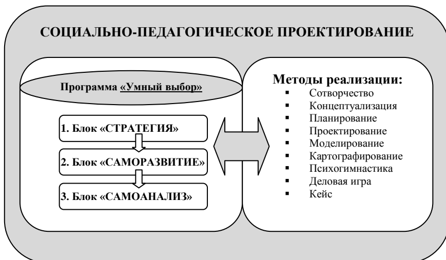
Рис.2. Социально-педагогическое проектирование развитие личностной самоорганизации.

Первый этап социально-педагогического проектирования является предварительным и заключается в комплексной диагностике в соответствии с методикой развития личностной самоорганизации посредством социально-педагогического проектирования, которая способствует сокращению времени поиска наиболее оптимального пути реализации личностной самоорганизации. Ядром данного алгоритма является авторская программа «Умный выбор», состоящая из трех блоков: « Стратегия » включает в себя определение стратегии личностной самоорганизации, способностей, склонностей и интересов личности, выявленных во время диагностики, проводимой на 1 этапе работы; « Саморазвитие » - второй блок программы, заключающийся в воплощении проекта-самореализации, направления которого были выбраны в процессе определения стратегии; « Самоанализ » - заключительный блок программы нацеленный на структурированный самоанализ, в процессе которого происходит оценка реализации социально-педагогического проектирования развития личностной самоорганизации в целом.